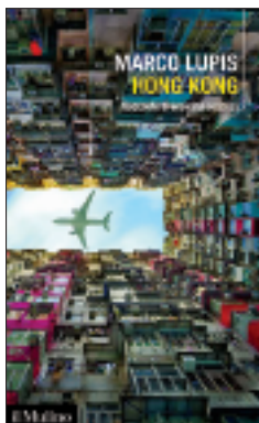
1. HONG KONG di Marco Lupis, il Mulino, pag. 364, 18 €.