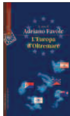
4. L'EUROPA D'OLTREMARE a cura di Adriano Favole, Cortina, pag. 298, 24 €.