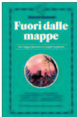
3. FUORI DALLE MAPPE di Alastair Bonnett, Blackie edizioni, pag. 360, 20 €.