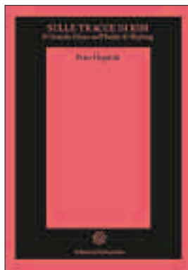
2. SULLE TRACCE DI KIM di Peter Hopkirk, Settecolori, pag. 282, 26 €.